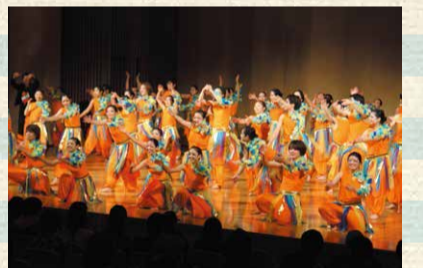
ダンスの躍動に圧倒されます