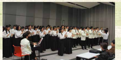
合唱の重ねられた旋律は見事です