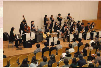
ビッグバンド JAZZ で スウィングしよう