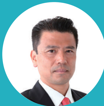
東洋経済新報社 編集局 記者・編集委員