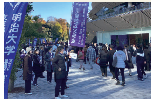
競技場外でも紫紺が圧倒した明早戦

“MEIJI SPIRIT”で奮闘する学生の姿には、いつも元気を貰っている。そして、関係者の方々には感謝しかない。「元父母の会」初イベントを素晴らしい勝利で祝うことができた。これを皮切りに、皆さんと共に、これからもMスポを、すべての明大生を、全力で応援していく力が湧きあがってきた。