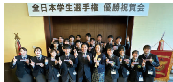
やっぱり明治がナンバー1!