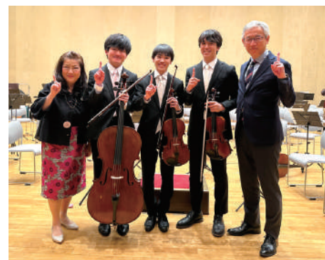
連合父母会創立50周年を明オケ演奏で盛り上げます!

来る3月3日の連合父母会創立50周年記念式典でも、入場の際のウェルカム演奏、式典の盛り上げ演奏、そして校歌演奏を行ってくださることになっています。